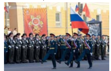
Рота РЭБ проходит торжественным маршем

Высокому результату предшествовала тяжелая ежедневная работа по обучению личного состава работе на технике РЭБ и совершенствованию его боевой выучки.