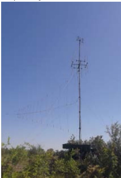
Автоматизированная станция помех на позиции

Для создания сложной и динамичной обстановки активного радиоэлектронного воздействия маневренные группы РЭБ выполняли учебно-боевые задачи на незнакомой местности, в ходе проведения полевых выходов, тактических (тактико-специальных) учений, в том числе с боевой стрельбой зенитно-ракетных соединений, воинских частей, а также ракетных войск и артиллерии на полигоне Капустин Яр.