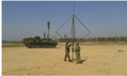
Личный состав отрабатывает нормативы по тактико-специальной подготовке