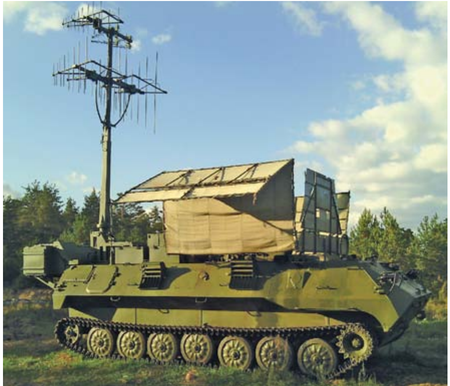
Изделие «Ртуть» на позиции

В соответствии с планом перевооружения сделан существенный про-