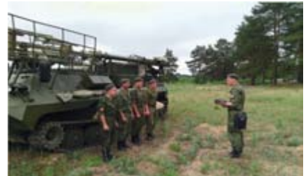
Личный состав при развертывании станции помех

штабных учений, тренировок, где отработывались вопросы практической организации и ведения РЭБ в операции (боевых действиях), оценивалась эффективность мер по исключению непреднамеренного воздействия своих радиоэлектронных средств, особое внимание уделялось обучению общевоинских командиров управлению войсками в условиях воздействия радиоэлектронных помех.