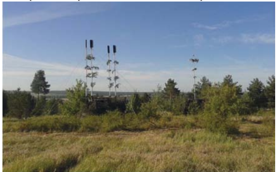
Автоматизированная станция «Житель» на позиции

Подготовка органов управления радиоэлектронной борьбой осуществлялась в ходе проведения командно-