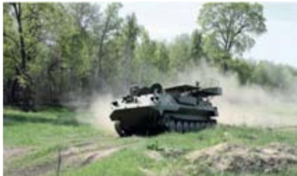
Станция помех на марше