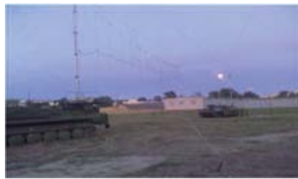
Станция помех на позиции

Проверка устойчивости связи к радиоэлектронному воздействию проверялась в ходе тактико-специальных учений, проводимых с войсками связи армии.